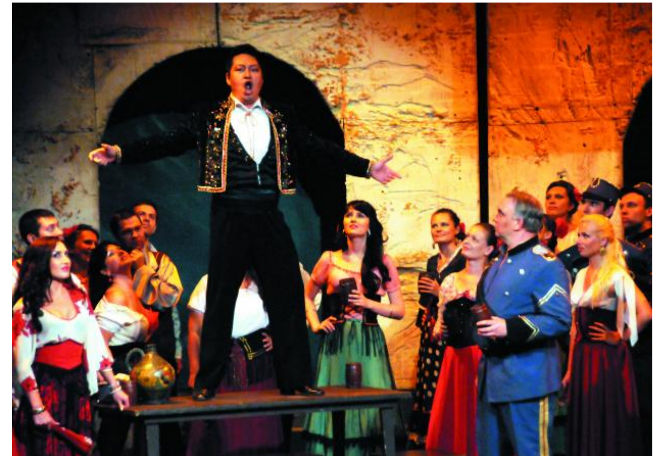
'Carmen', de Georges Bizet, es una de las óperas predilectas del público y muy habitual en los repertorios líricos.

—Soy muy optimista, ya que la cultura está siempre viva, es una necesidad humana. El que la ha adquirido no puede prescindir de ella. En breve estaremos viviendo mejores tiempos, no solo en cultura sino nuestras vidas en general.