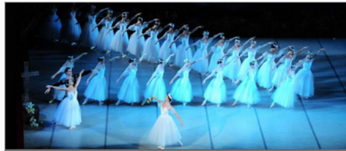
Una escena de la obra 'Giselle', a cargo del Ballet Nacional de Odessa, que esta noche llega a León.

Giselle vuelve a bailar esta noche en el Auditorio Ciudad de León. Medio centenar de bailarines del Ballet Nacional de Odessa pondrán en escena el clásico de Adolphe Adam, que narra el amor entre la campesina Giselle y el Conde Albrech. Considerado el ballet romántico por excelencia, con coreografía de Marius Petipa, Jean Coralli y Jules Perrot, llega a León una de las mejores compañías de Ballet de Europa de la mano de Concertlírica.